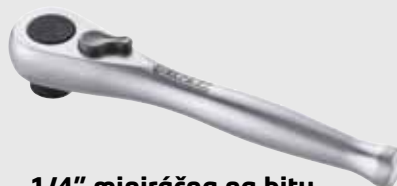
1/4" miniráčna na bity